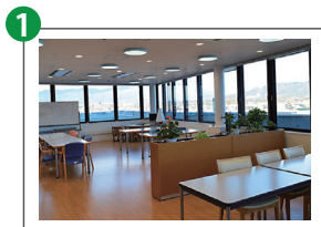
1 食堂 (飲料自販機)