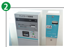
2 TVカード販売機 TVカード清算機