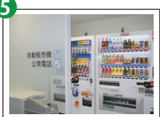
自販機・公衆電話