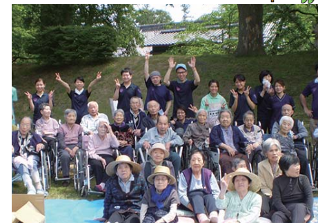
▲外出企画の一つ「観覧会」

また、認知症専門棟も有し、認知症状を有する方に対し、専門的なケアを行なっています。